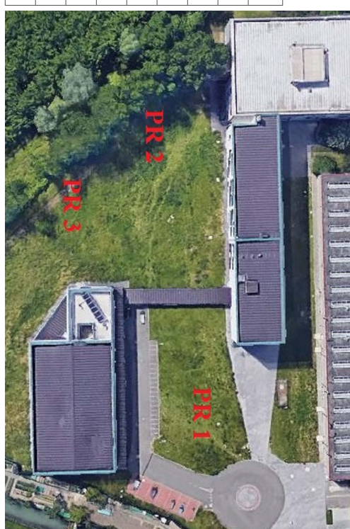
PLANIMETRIA GENERALE DISPOSIZIONE PUNTI DI RITROVO